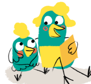
Illustration : © Mylène Rigaudie / Milan Presse 2020.

GEO ADO , tous les mois une fenêtre ouverte sur notre monde complexe et passionnant.